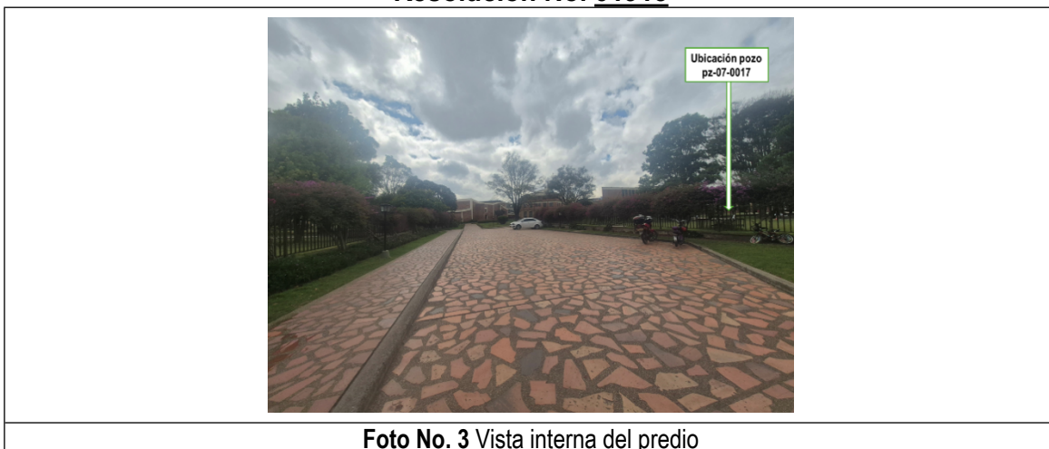
Foto No. 3 Vista interna del predio

El pozo identificado con código pz-07-0017 se encuentra inactivo y está protegido por una caseta de hierro cubierta por tejas; la boca se sitúa dentro sobre una estructura de cemento de 0,70 x 0,60 x 0,12 metros (Foto No. 3, 4 y 5), el punto de aguas cuenta con tubería de producción, llaves de paso, medidor instalado marca H – Meinecke y lectura acumulada de 59171 m 3 , placa de identificación y georreferenciación (Foto No. 6 y 7).