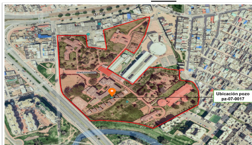
Imagen No. 2. Ubicación pozos pz-07-0017