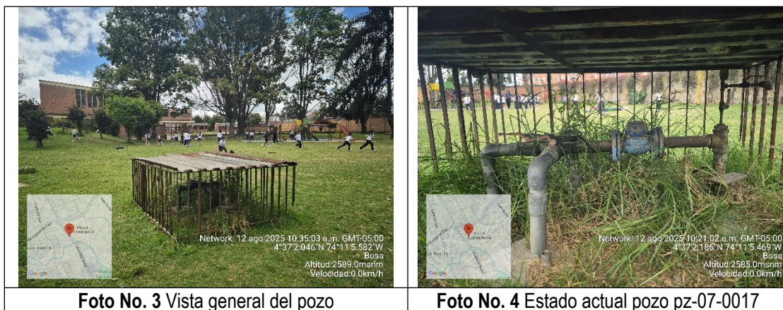
Foto No. 3 Vista general del pozo

El pozo identificado con código pz-07-0017 se encuentra inactivo y está protegido por una caseta de hierro cubierta por tejas; la boca se sitúa dentro sobre una estructura de cemento de 0,70 x 0,60 x 0,12 metros (Foto No. 3, 4 y 5), el punto de aguas cuenta con tubería de producción, llaves de paso, medidor instalado marca H – Meinecke y lectura acumulada de 59171 m 3 , placa de identificación y georreferenciación (Foto No. 6 y 7).