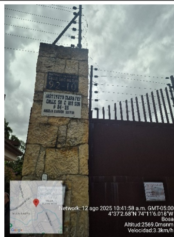
Foto No. 2 Nomenclatura del predio