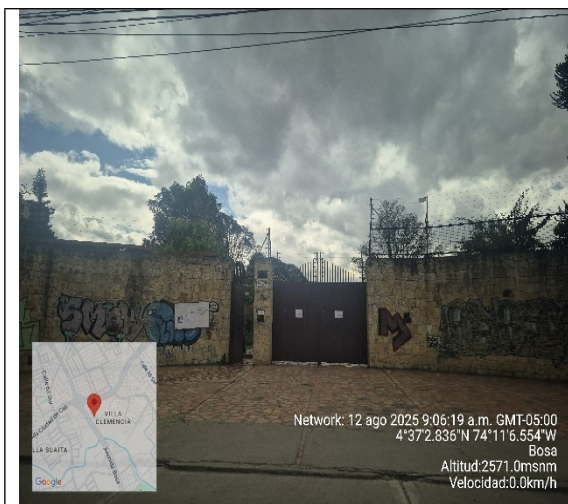
Foto No. 1 Fachada del predio

El día 12 de agosto del 2025 se realizó visita de control en la Calle 58 C Bis Sur No. 84-20 con el fin de verificar las condiciones actuales del pozo identificado ante la Entidad con código pz-07-0017 (CLARA FEY No. 2), el cual se sitúa en el área denominada como “El Bosque” junto al parque infantil (Foto No. 1 y 2).